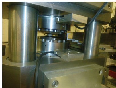
Enclumes de la ROTOPEC comprimant un joint contenant l'échantillon

Or, de la chimie aux géosciences en passant par la physique des liquides et les sciences des matériaux, c'est désormais une évidence, « les problématiques actuelles de recherche plaident pour un tel instrument » explique Yann Le Godec. D'où l'idée de la ROTOPEC, un instrument dont le développement a été soutenu par le réseau de technologie des hautes pressions et par la Mission