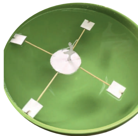
1. Capture d'écran du film « La patineuse fantôme » ( https://www.youtube.com/watch?v=P8KXiZ8zFDw ).

Une autre initiative, « Merci la physique », a été lancée récemment sur YouTube par J.M. Courty, qui exécute plusieurs expériences chez lui, que chacun doit pouvoir reproduire aisément avec des « moyens du bord » (voir p. 5). Les expériences confinées que conduit une petite équipe pilotée par Julien Bobroff s'adressent à des étudiants plus avancés, mais dans le même esprit.